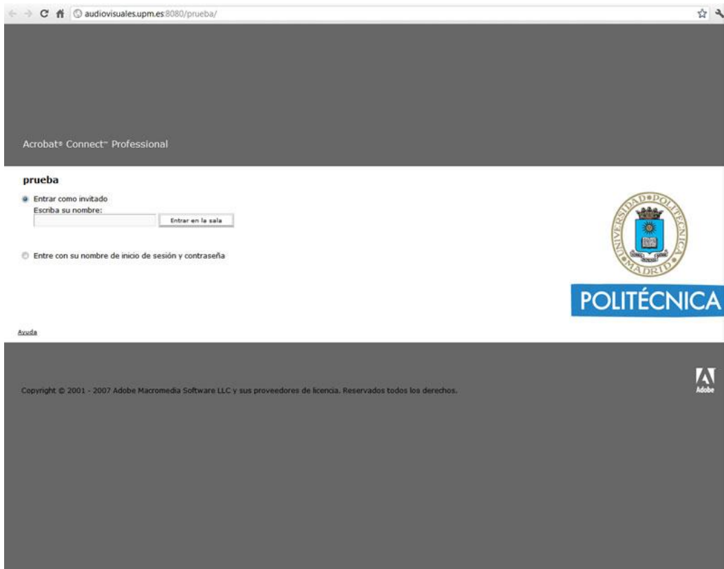
Fig. 1.- pantalla de inicio en la sesión

Gabinete de Tele-Educación Vicerrectorado de Tecnologías de la Información y Servicios en Red